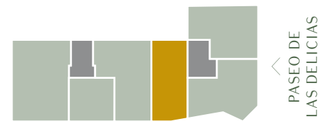
C/ PALOS DE LA FRONTERA